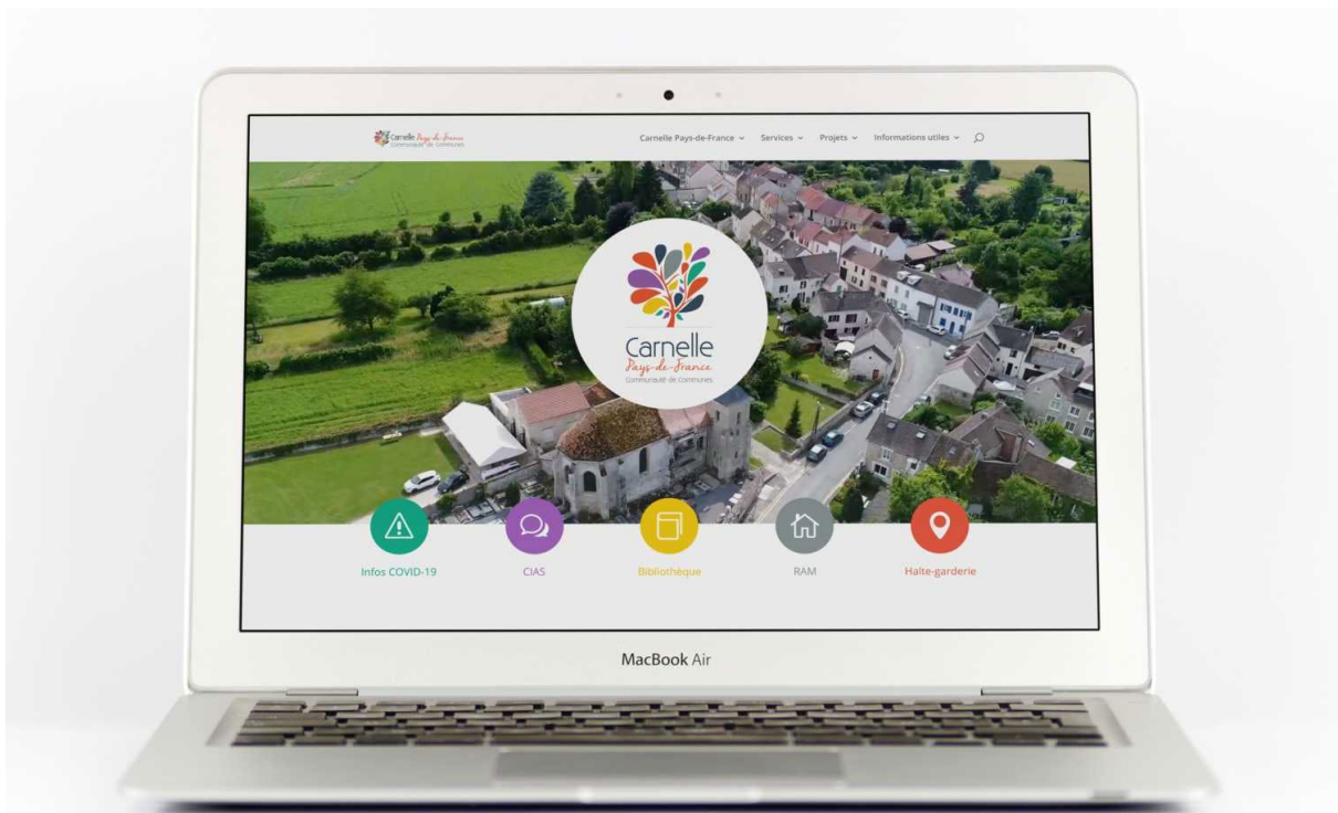
Nouveau site de la communauté de Commune Carnelle Pays de France